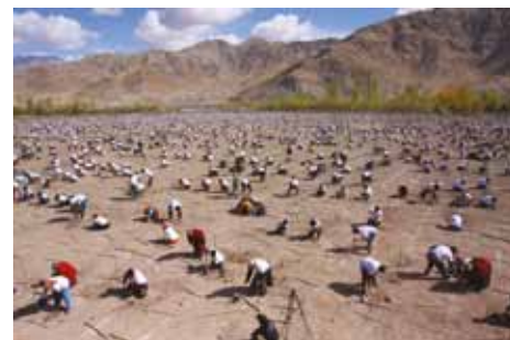
Live To Love pflanzt 150.000 Bäume im Himalaya

Der Gyalwang Drukpa ist das religiöse Oberhaupt der 1000-jährigen Drukpa-Linie des tibetischen Mahayana Buddhismus. In Bhutan ist die Drukpa-Philosophie als Staatsreligion fest verankert. Er ist Träger vielfältiger, internationaler Auszeichnungen, unter anderem vom Millennium Development Goals Award der UN.