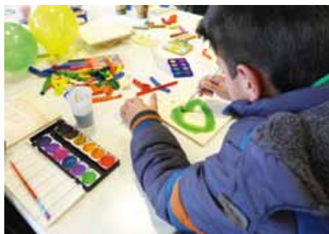
Mal-Aktion für Flüchtlingskinder

Das Motto „Leben um zu Lieben“ ist der Grundpfeiler der Stiftung „Live To Love“. Mit diesem Fundament unterstützen die Mitglieder von Live To Love Germany mit Sitz in Hamburg sowohl lokale als auch internationale Hilfsprojekte durch ehrenamtliche Arbeit und Spenden – immer unter einem ganzheitlichen Ansatz. Neben Bildung, Umwelt- und Tierschutz sowie der weltweiten Gleichstellung von Frauen, stehen auch medizinische Hilfe, akute Krisenintervention in Notgebieten und der Erhalt des kulturellen Erbes im Fokus sämtlicher Aktivitäten. Die deutsche Stiftung ist dabei Teil des internationalen humanitären Live To Love-Netzwerkes und kann so nicht nur in Hamburg und ganz Deutschland etwas Gutes tun, sondern auch internationale Projekte tatkräftig unterstützen.