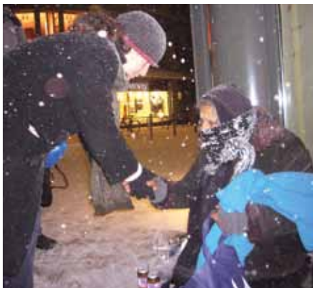
Verteilung von Hilfsgütern an Obdachlose in Hamburg

Sie schicken etwas von hier in die eine Richtung und werden mit Sicherheit aus der anderen etwas zurückbekommen“, so der Gründer, Seine Heiligkeit der 12. Gyalwang Drukpa. Genau durch diesen Ansatz hat die Live To Love-Stiftung weltweit Unterstützer, darunter auch Prominente wie die Schauspielerin Susan Sarandon. „Das Besondere an der Stiftung: Jeder kann einen Beitrag dazu leisten, dass die Projekte ein voller Erfolg werden – unabhängig von seinem religiösen oder sozialen Hintergrund.