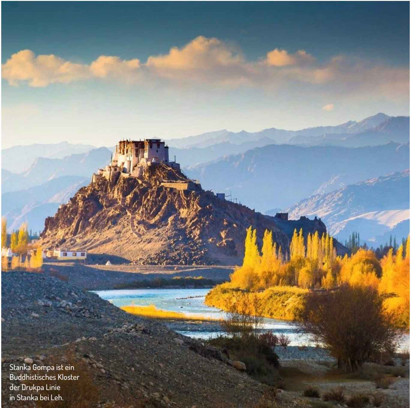
Stanka Gompa ist ein Buddhistisches Kloster der Drukpa Linie in Stanka bei Leh.