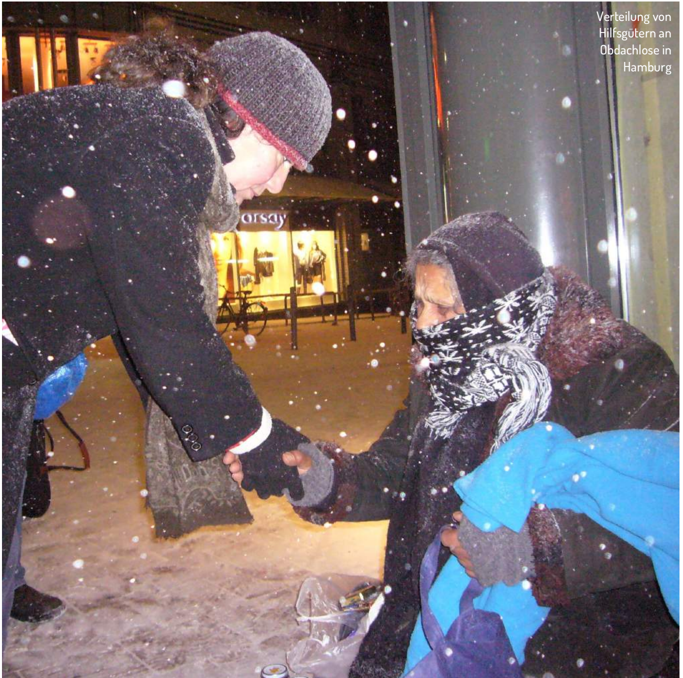
Verteilung von Hilfsgütern an Obdachlose in Hamburg