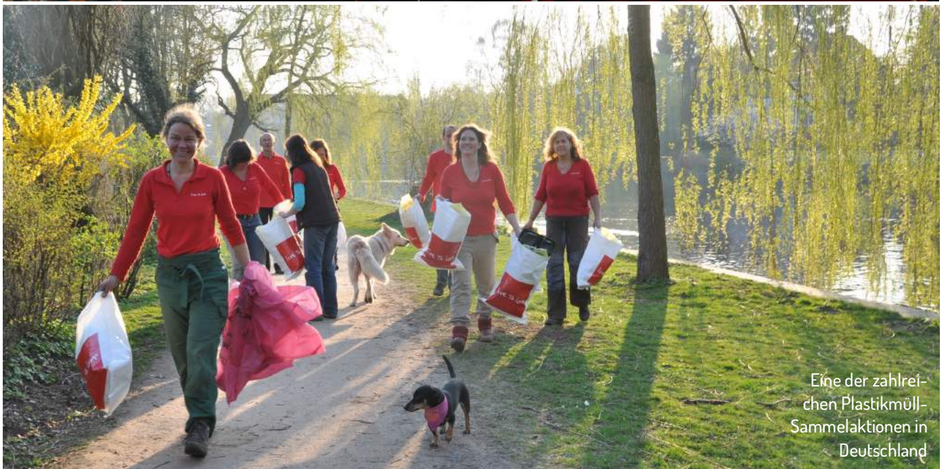
Eine der zahlrei- chen Plastikmüll- Sammelaktionen in Deutschland