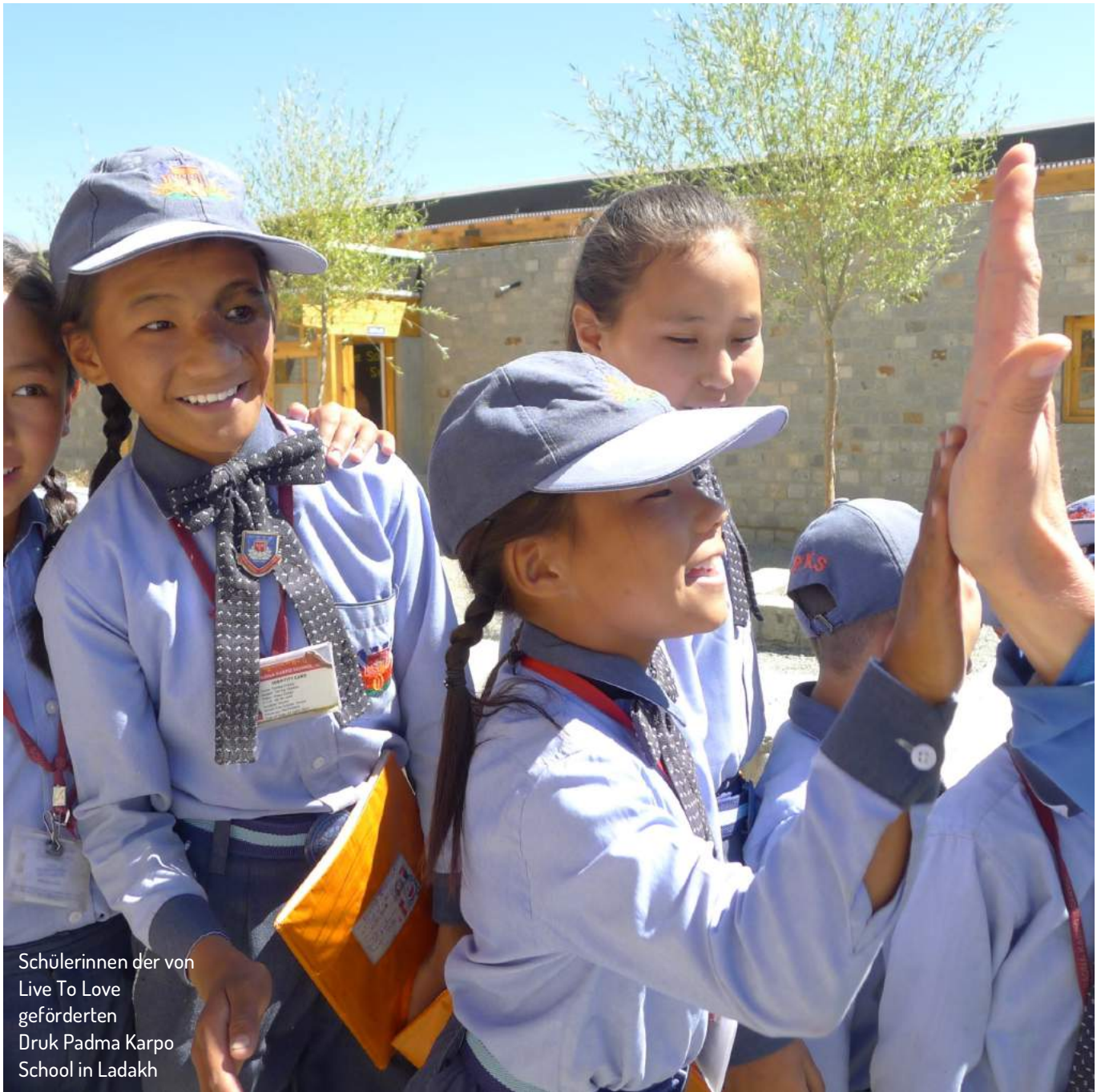
Schülerinnen der von Live To Love geförderten Druk Padma Karpo School in Ladakh