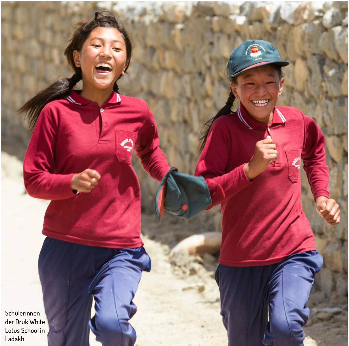
Schülerinnen der Druk White Lotus School in Ladakh