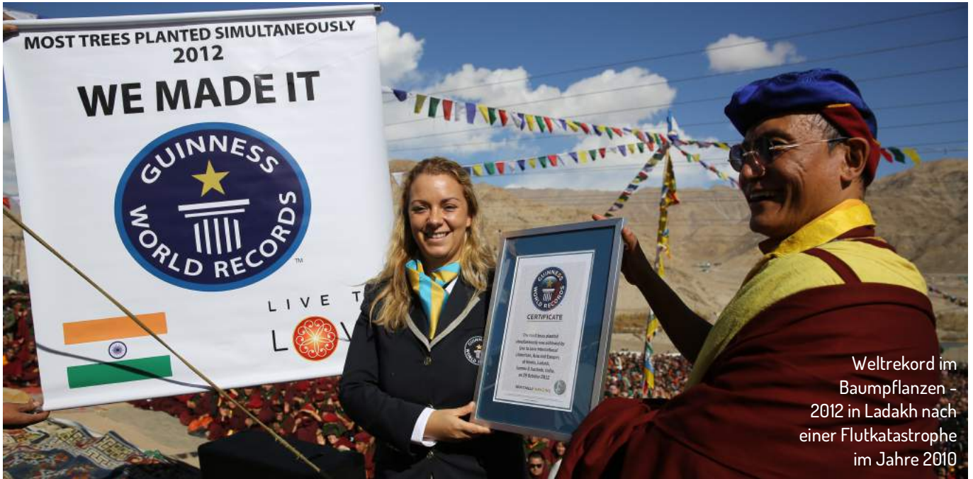
Weltrekord im Baumpflanzen - 2012 in Ladakh nach einer Flutkatastrophe im Jahre 2010